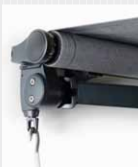
FA46 Pitch Control