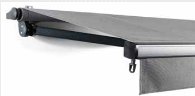
FA44 i profil