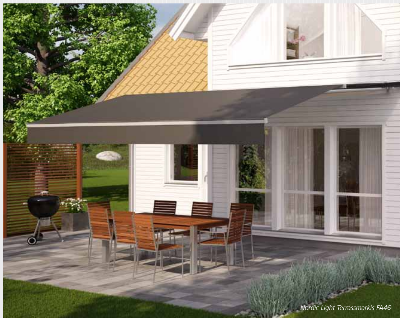
Nordic Light Terrassmarkis FA46

Smart tillval: Med motorstyrningen SmartControl kan markisen manövreras av en iPhone-app via wifi.