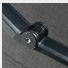
Knäled utrustad med Dyneema® band.