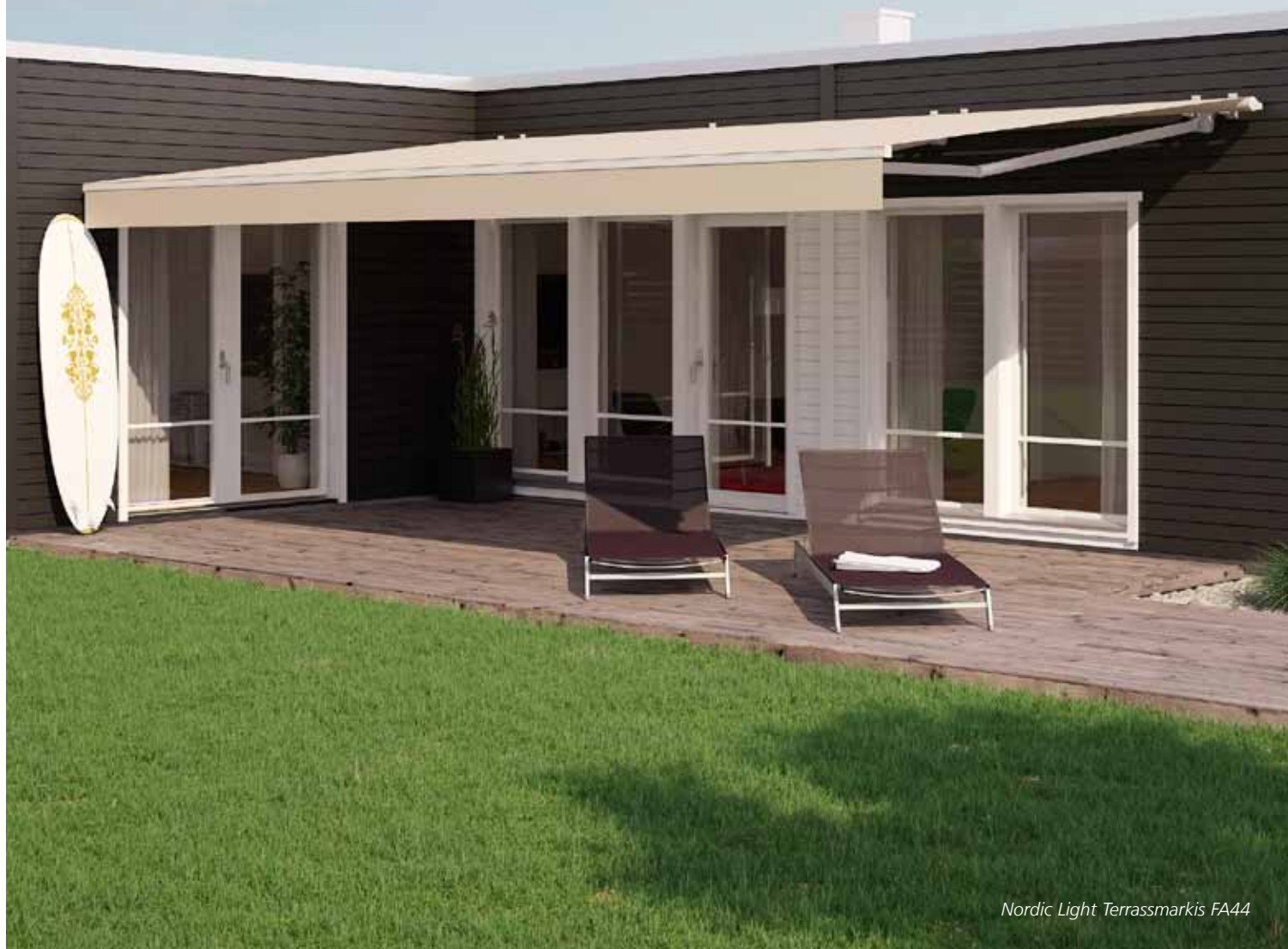
Nordic Light Terrassmarkis FA44