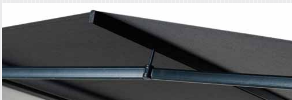
FA46 – Extra st h jd med dukbalk